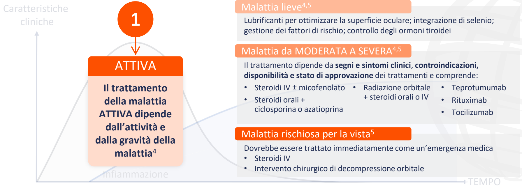
Grafico riprodotto da Maurya RP, et al. Int J Ocular Oculoplast. 2021;7:117–30 (CC BY 4,0 www.creativecommons.org/licenses/by/4.0/ ).

IV, endovenoso; TED, malattia oculare tiroidea.